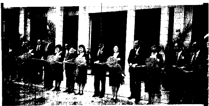
南投縣農會精製茶廠落成孫廳長等剪綵

春作應注意銹病防治，以減少損失。防治方法可任選左下表一藥劑防治。其他病虫害防治及雜草防除，請參照農林廳編印之植物保護手冊辦理。■