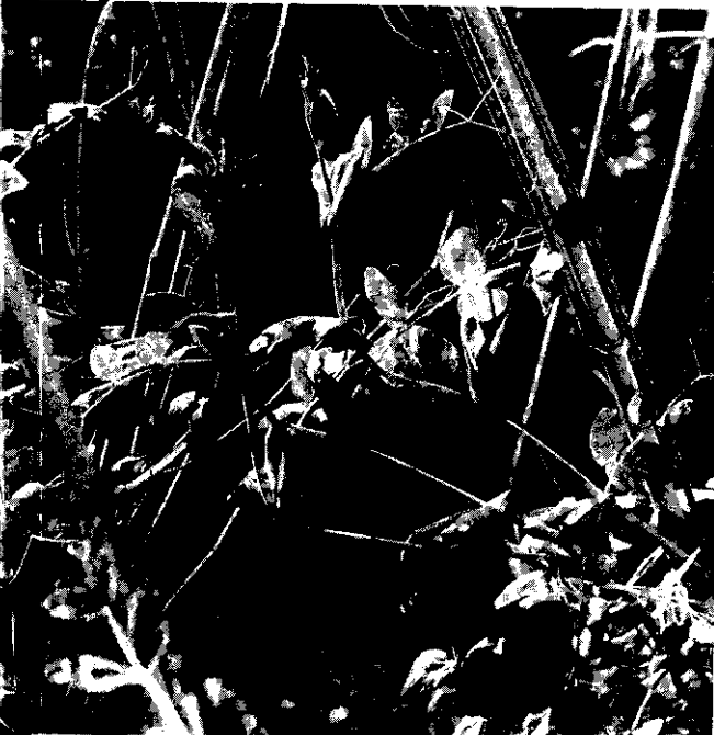
豆株慢慢爬上籬架

花藜豆為硬莢菜豆的1種，與菜豆（皇帝豆）同為喜冷涼氣候，平地一般在8月開始播種，前者大概在國曆10月底開始採收，後者大概在11月以後陸續採收。種子在一般種子行都有售。（郁宗雄）