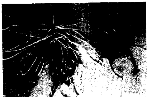
施用強根強壯素根旺有力尾

這是以前的天力補 100號強根素 306號強壯素 305號磷素 } 最理想的混合物