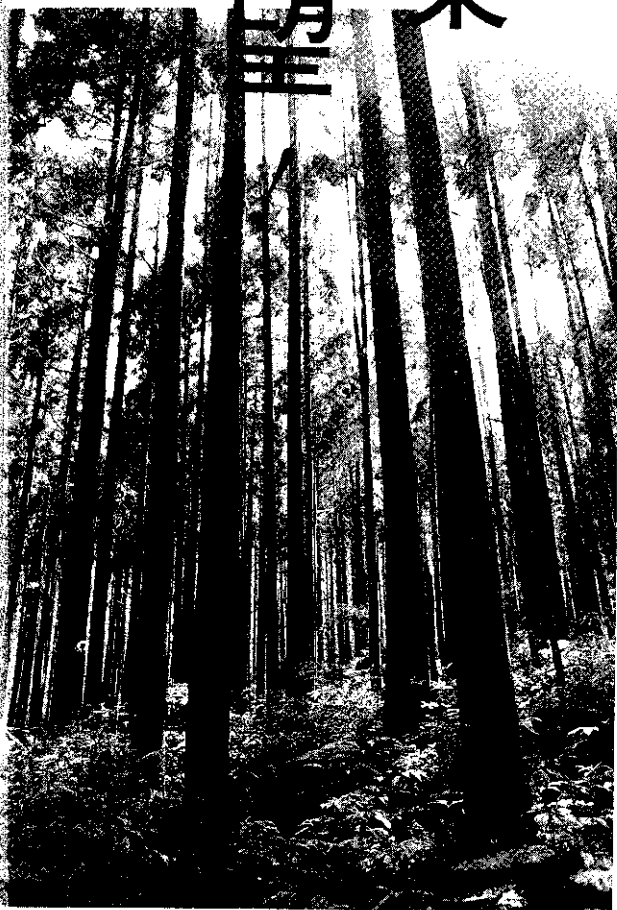
溪頭的柳杉林

林務局局本部組織原有7組5室分設34課，將精簡為5組3室分設27課，並依將來首要任務分為森林企劃、集水區治理、林政管理、造林生產及森林育樂等組；原有13個林區管理處依東、西、南、北4區每區設置2個林區的構想，酌予調整裁併為