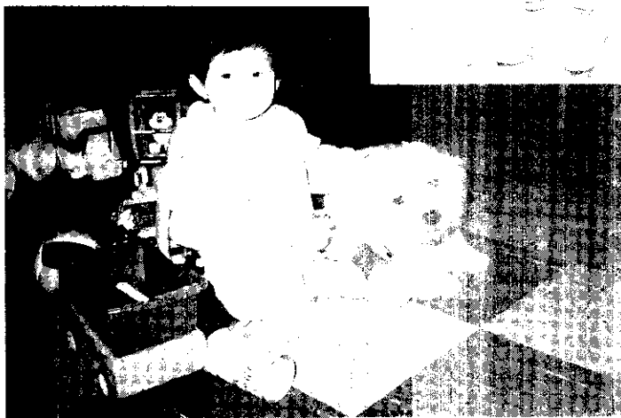
孩子隨時都需要父母的關懷與指導。

比較父母親的反應，母親較父親會專心聽孩子講，並提供意見，而父親則較會要孩子自己解決。