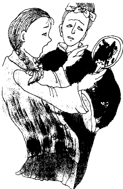
鏡裏出現的親友、老家令母女二人驚異不已！

隆隆的聲響，阿嬌大吃一驚，回頭一看，石壁裂開了，「嘩」，滾起一隻金元寶。阿嬌剛想去揀，石壁已越裂越大，像大門洞開似的。朝門內一瞧，哇，裡面珠光耀眼，寶氣奪目，五顏六色的珍珠瑪瑙，翡翠玉器，堆集成丘，金銀錢幣更不計數。阿嬌畢竟是個孩子，好奇走進石壁，東摸摸西瞧瞧，每種東西都令她愛不釋手。