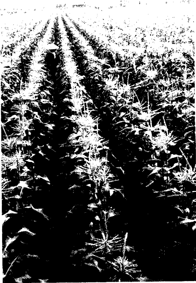
飼料玉米種植面積比去年增加一成

本年一期作物目前已開始進入種植期，由於受到工資大幅上漲、76年二期水稻價格上升，及稻田轉作的影響，各主要作物的種植面積，有很大變動：