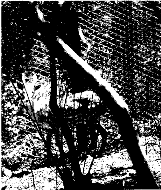
先以圈飼方法放養，以後再讓它悠遊於大自然的山野。

前，進行梅花鹿及其生理習性的調查。第二期自75年11月到77年底，為放養期。第三期