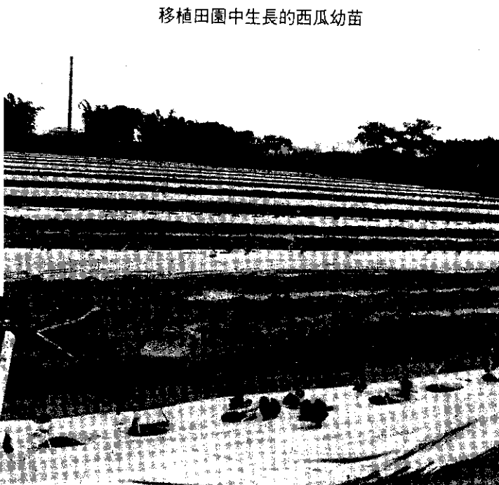
移植田園中生長的水瓜幼苗

學甲鎮農會為配合政府政策，鼓勵農民稻田轉作，維護農民收益與發展地方特產，在（77）年度輔導農民推廣種植紅色瓜子西瓜。