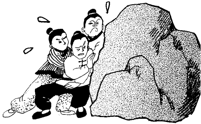
三人合力終於將千斤大石推開來！