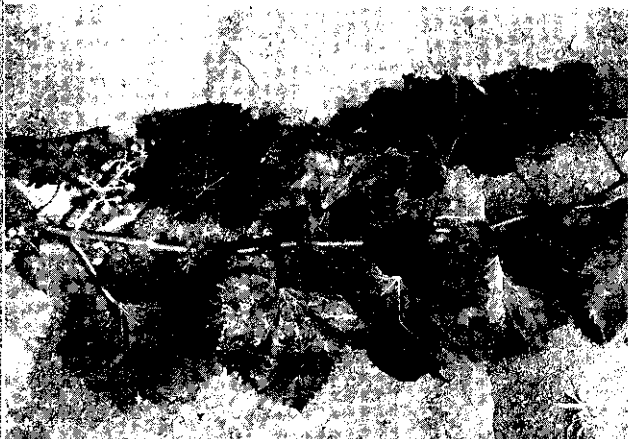
巨峯葡萄因殺草劑為害，結果枝葉片皺曲，結實不理想。

開花前或開花後至少1個月之內不要使用殺草劑。使用殺草劑之後至少10天以內不要澆水。天氣預報可能下雨的近期內也不要噴施殺草劑。最好採用草生栽培法，完全不要使用任何殺草劑。