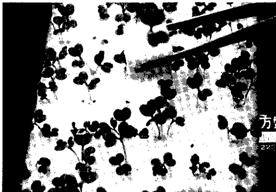
種子在海綿上育苗，發芽整齊。