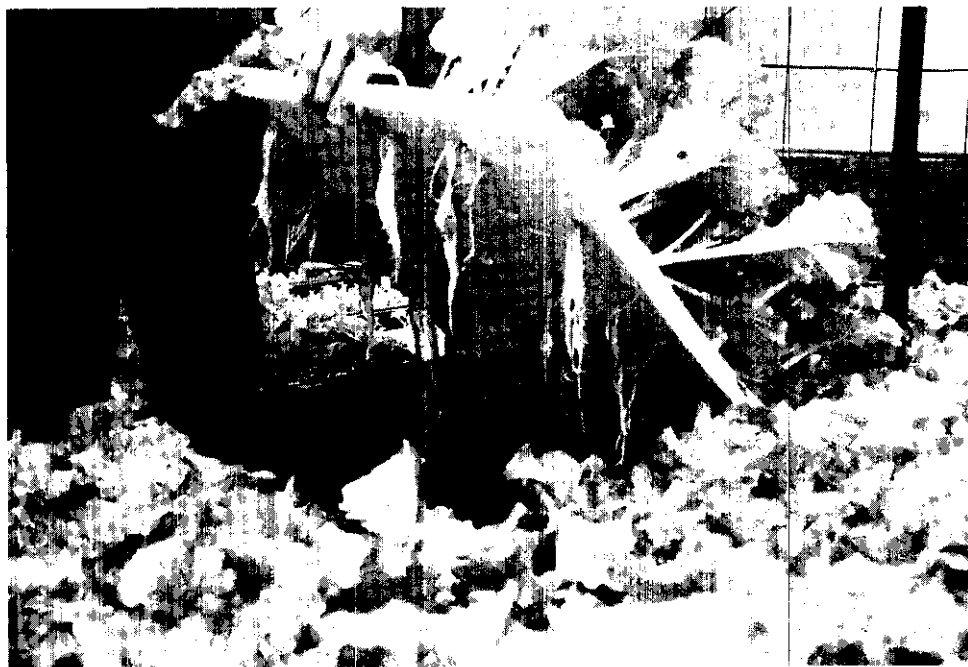
穿了「鞋子」的小白菜最新鮮

設施園藝中的水耕栽培蔬菜，由於不含殘留農藥，清潔、脆嫩、衛生，而適合生食，自打入市場後，倍受消費者的歡迎，銷售量也扶搖直上，為農民增加可觀的收益，這是水耕蔬菜在市場競爭上最大的利器。