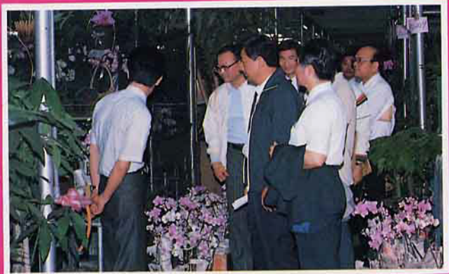
台北市政府致力輔導花卉產銷公司建立健全交易制度