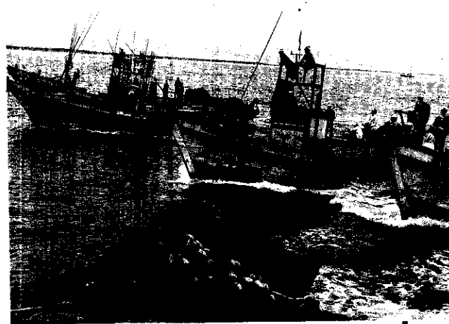
動員漁船，將天安門事件真相傳播給大陸同胞。

學生的呼籲沒有得到響應。一個多小時之後，以裝甲車開道，防暴警察和士兵圍攻的陣勢直向天安門中心的紀念碑衝來。