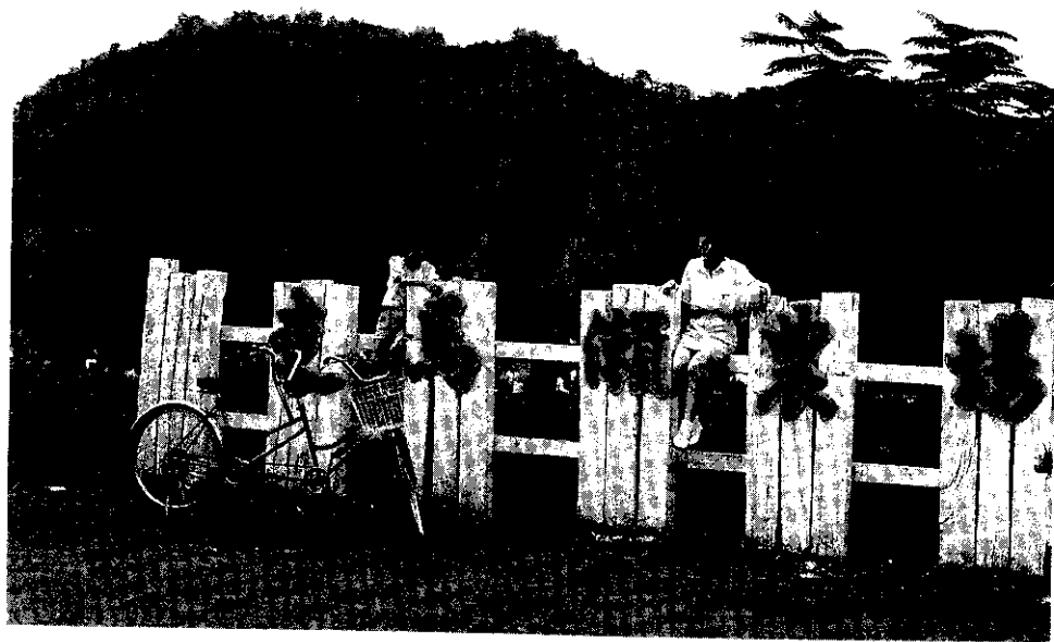
遊客入場。 走馬瀨農場景觀優美，去年1年就有20萬人次