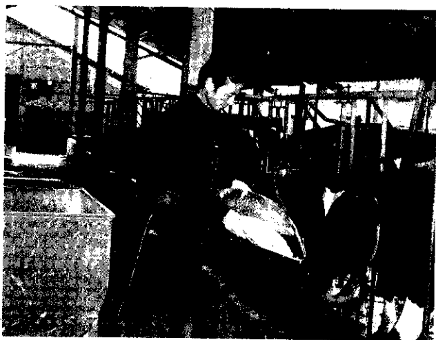
定時定量餵飼料，乳牛長得壯而肥。

民國65年，在大家的期盼下，中部青年酪農村終於在通霄鎮南和地區的山坡上開始建立起來。這片起伏不大的坡地，佔地約50餘公頃，經過了年餘的開發，才次第規畫成像樣的牧場，17位酪農青年