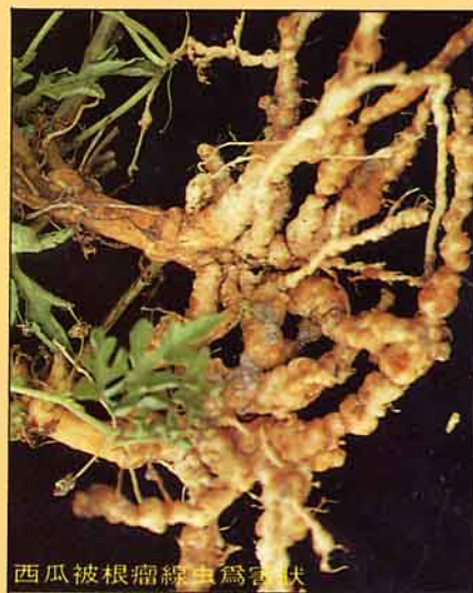
西瓜被根瘤線蟲為害狀