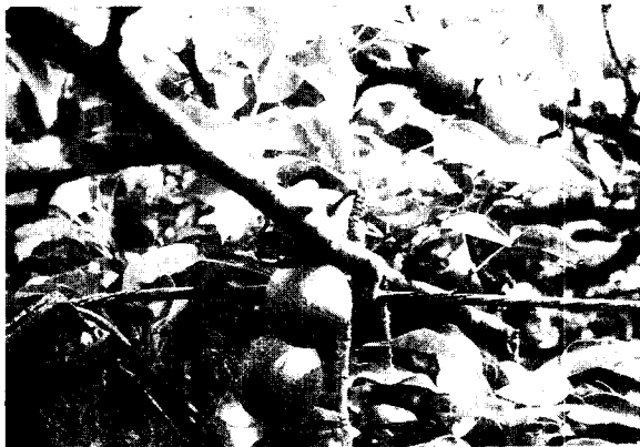
→ 集團轉作園藝面積為7,936公頃

正面效果：為有效控制稻米生產，一方面確保安全存量之需要，另方面避免稻谷再次生產過剩，未來6年稻米供需大致維持在185萬公噸左右，每年轉作成效，今後在稻田轉作後續計畫中，將加強下列措施：