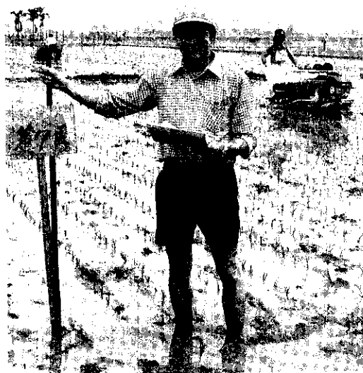
集團轉作面積，本年度訂為42,262公頃。

為提高農民所得、兼顧種稻收益及維護稻田轉作誘因，以落實稻田轉作成效，農委會積極加強稻田轉作相關措施，先後擬具「適度增加稻谷保證價格收購量計劃」，「調整稻田轉作補貼標準」及「國產雜糧保證價格收購改進措施」等三案，經行政院通過，核定自本（78