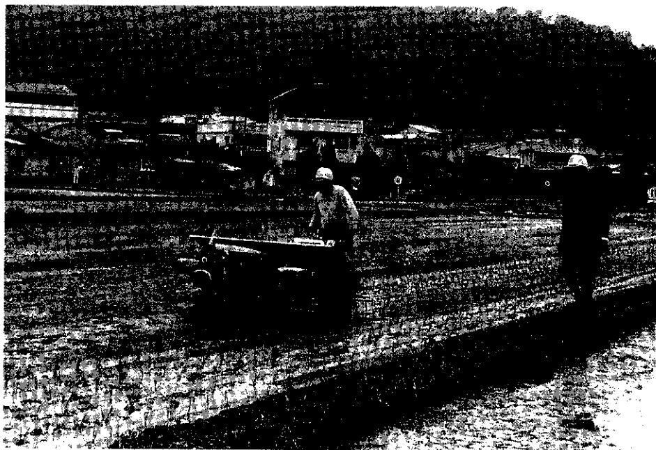
本年度稻田轉作的最大特點，是加重推行集團轉作。

稻田轉作後續計劃，經由行政院原則通過，自79年起，繼續推動6年；農委會為使前後兩階段能銜接連貫，經已核定79年度稻田轉作細部實施計劃，總預算1億9750萬元，執行期間自78年7月起至79年6月止。