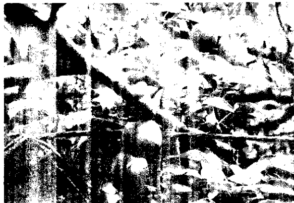
→ 某團轉作園藝面積為7,336公頃

下田栽果；為有效控制稻穀產量，一方面確保安全存量之需要，另方面避免稻穀再次生產過剩，未來6年稻米供需大致維持在185萬公噸左右，每年轉作成效，今後在稻田轉作後續計畫中，將加強下列措施：