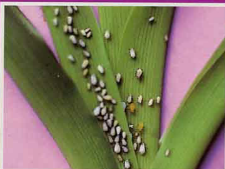
印度黃花蚜在葉背吸食養液