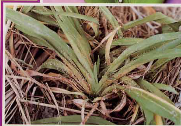
植株上滿布金針綠蚜