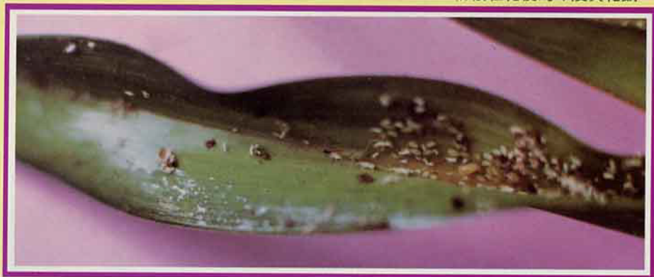
金針綠蚜為害葉片，造成黃化。