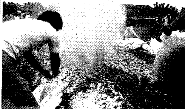
洒上石灰銷燬