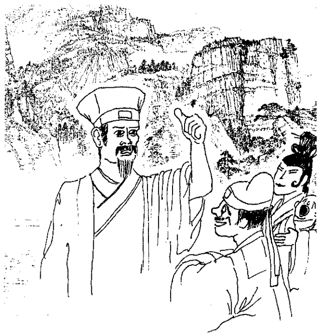
地理師向張家指點了一個好風水。

從前臺南縣玉井鄉的口宵里地方，有一張姓的豪族，因要埋葬先代的遺骨，特地派人到唐山聘來了一位聞名的地理師，每天以酒肉款待，並陪同他到附近各地觀察地理，希望能夠找一個風水好的地方，以埋葬先代的遺骨。