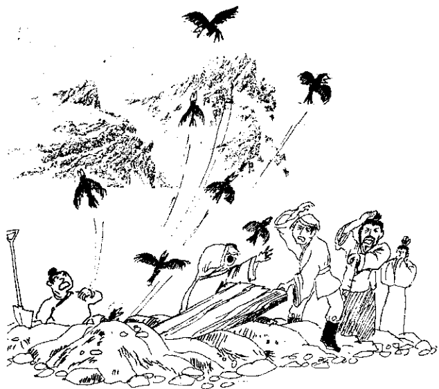
張家開棺後竟有九隻烏鴉衝天飛出。

跛足進士雖然過著如此豪華富裕的生活，但他一家人對平民卻不道不德，有時他們甚至以屎或蛆殼灑在路上，而將他的官服掛在樹上，糟塌過路人下跪。據傳跛足進士就是張家祖墓內飛出來折斷一隻腳腿的那隻烏鴉化身。因此，每當烏鴉在頭上飛過時，大家都非常討厭，都認為是不祥之兆。