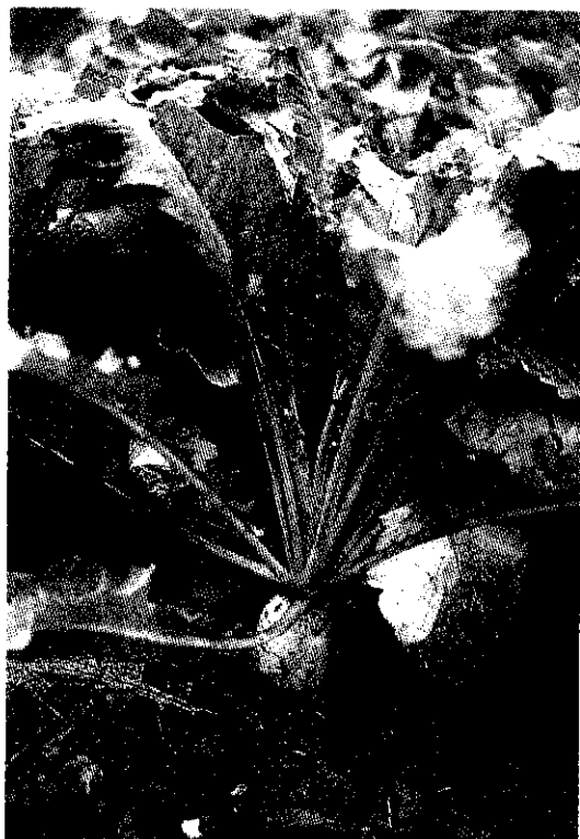
南、北部消費者喜愛的蘿蔔重量不一。