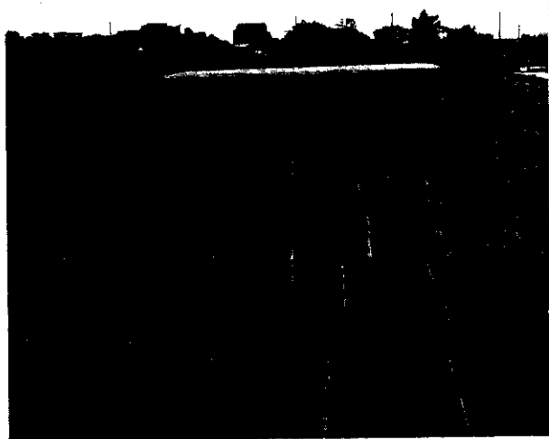
農家在農場經營上努力與政府採取各種指導配合措施，是農業所得提高的原動力。

民國77年平均每戶農家所得，如依其來源分：由從事農場經營而來的，所謂農業所得為129,590元，佔農家所得中的38.92%，比上年115,689元增加13,901元或增加12.02%；另外，由農家成員專、兼從事於自家農場以外工作，而所獲之報酬（包含從事自家農場以外之其他農事工作：如代耕、代插