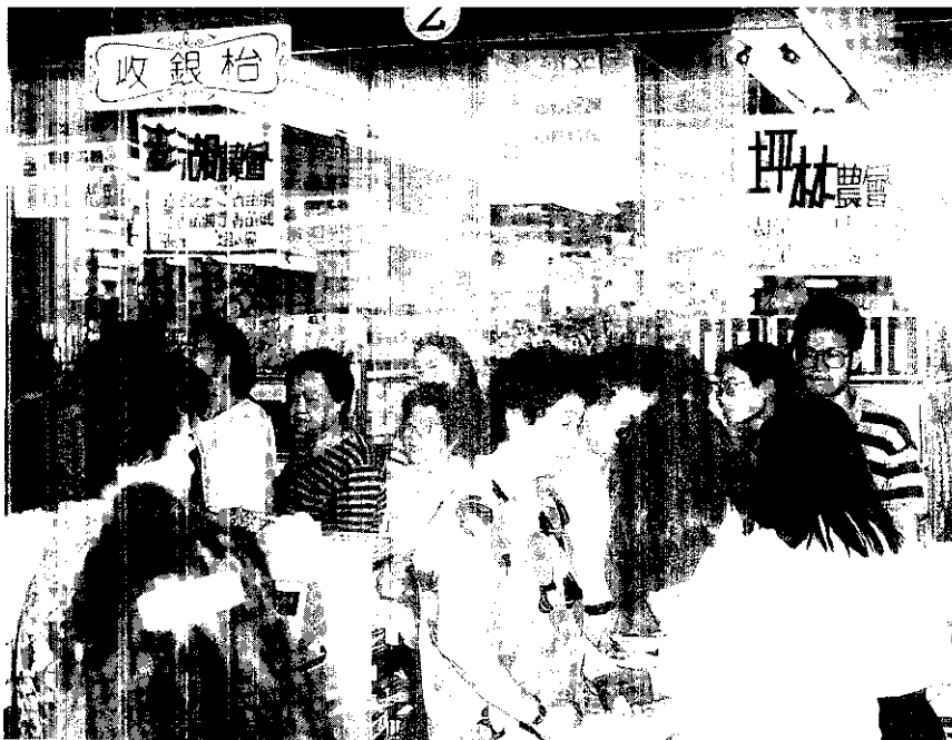
台北市農特產品第六直銷中心，於10月20日開幕，各鄉鎮農會提供的優良農特產品，吸引一批批購貨人潮。該中心設在承德路，台北縣三芝鄉農會經營。(梁豐攝)

豐原 豐原市農會於9月23日安排一系列綜合講習會，包括4單元：一、認識血壓及高血壓防治宣導。二、膳食營養展示觀摩會。三、土風舞研習。四、幸福婚姻專題講座。(吳信貞)