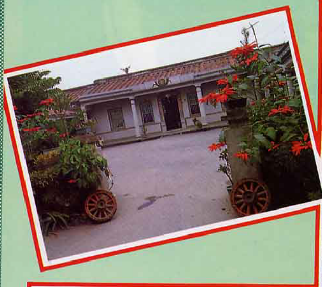
大雪山森林遊樂區設有林間小屋

讓我們的農村留下一片淨土，保持原有田園之美，提供良好休閒去處，裨益國民身心健康。休閒農業志在於此，確是一項健康的農業政策。