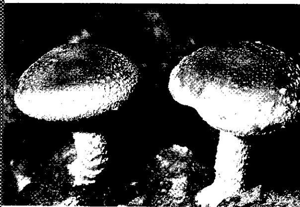
生鮮的香菇是未來本省香菇市場消費的主流

所以，從前是優點的地方，沿至今日已衍變成限制本省香菇產業發展的因子。本省香菇產業若要繼續維持，唯有減少乾香菇產量，提高品質，再逐漸由完全乾香菇市場轉入新鮮香菇市場，方有可為。