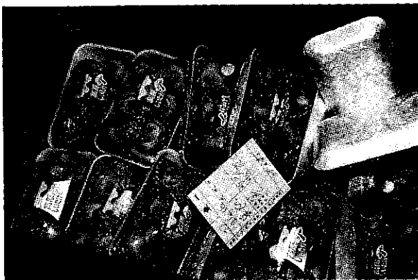
日本市場上的鮮菇小包裝

最短期間內送入冷藏庫中冷藏至 2°C，確保香菇新鮮度和品質，並以自動包裝機分成適宜超市銷售的小盒裝，用冷藏車運送至超市銷售。除此之外，為提高乾香菇品質，也輔導子母罐包裝法，藉貯存奶粉方式來改善香菇貯藏時間，提高品質，期能打入高級禮品市場。