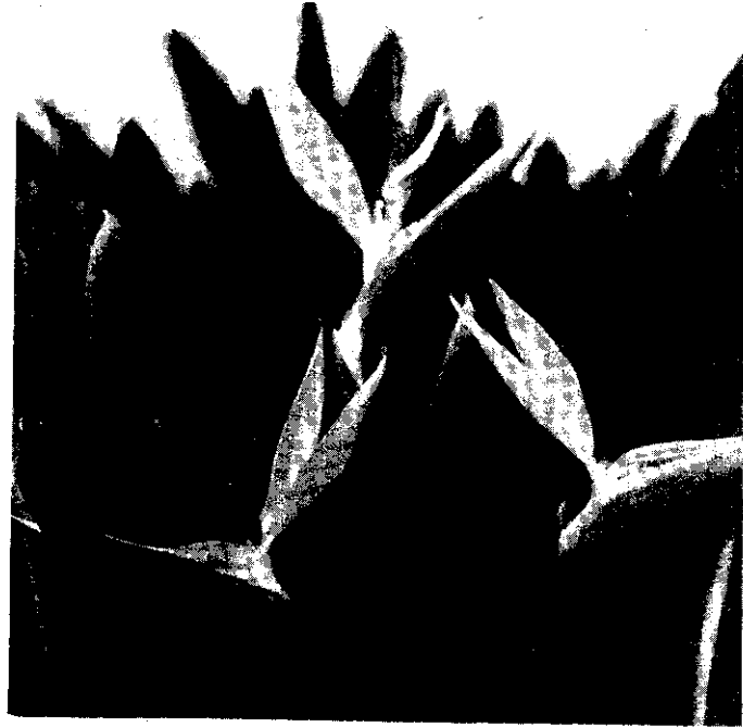
天堂鳥在本省切花市場相當受歡迎，外銷日本、香港和新加坡，價格非常好。

民國77年，天堂鳥切花在日本全年平均批發市價約35元左右，如此高單價，在目前水稻栽培無法獲利情形下，雜糧作物又需政府補貼，工資昂貴、僱工不易等因素，個人建議政府有關單位應加強輔導專業區切花成立，以及外銷市場的開發，既可使農友重新對農業獲得信心，並可減少政府對農業補貼，又可美化環境，提高國民生活水準。 ■