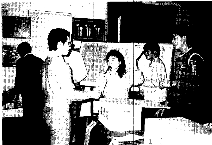
士林四健會區幹部選舉

五結 五結鄉農會於去年11月24日至12月15日止，分六梯次辦理核心農民培育訓練。參加