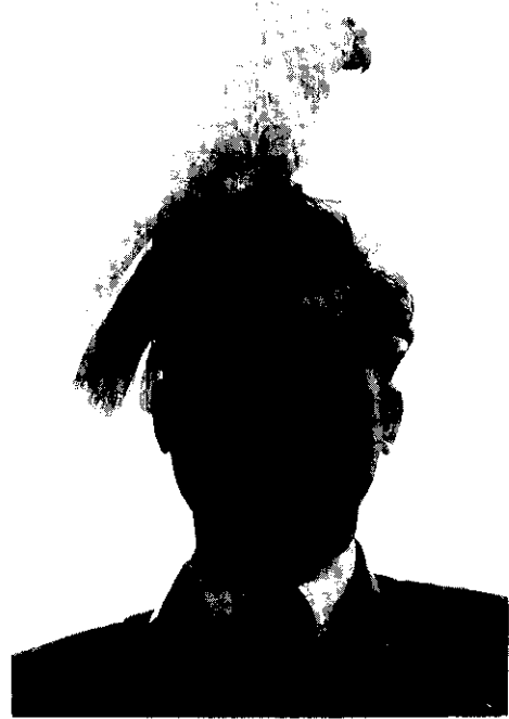
鸚鵡調教