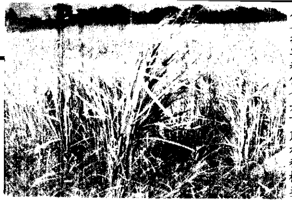
農藥損害稻作(右下角水稻枯萎)