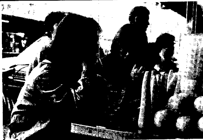
多喝胡蘿蔔汁可幫助消化