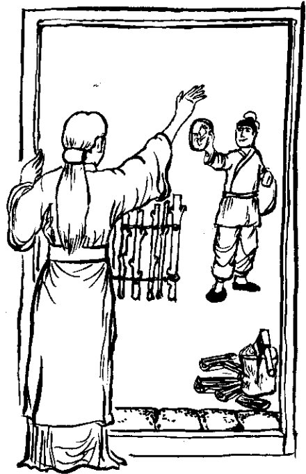
范生離家時，妹妹綉了兩幅畫相，藉慰遙想。