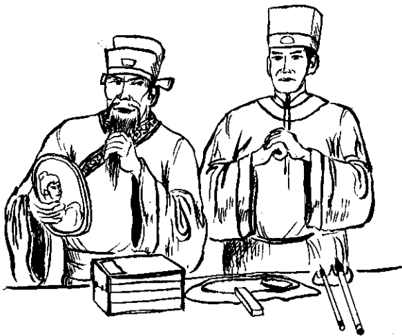
范生婉言相拒，不料得罪了閩太監。

英彩叩頭稱是。閩太監的詭計揭穿，皇帝下令把范志文從天牢內放出來，官復原職，並判閩福錦誣告及欺君之罪。同時十分欣賞英彩的機智勇敢，美與膽識。