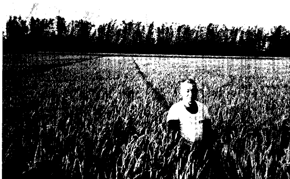
年輕人不願意務農，農村中只見老人留守田園。

稻田轉作6年計畫自73年推行以來，除達成紓解稻米生產過剩及倉容壓力外，對減輕政府財政負擔、改善農村經濟、提高農民所得、調節農業資源合理分配與利用，以及發揮各級農業單位組織功能等等，均有正面效果與意義。