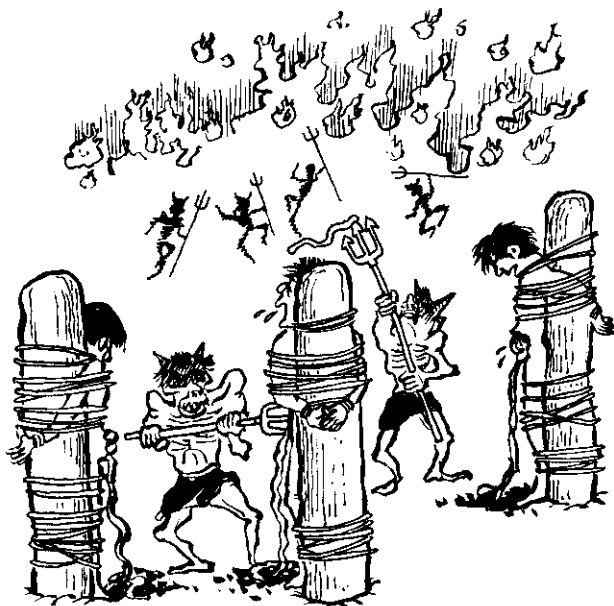
罪魂被陰差鬼卒穿腸破肚

此故事轉錄自臺中聖賢堂所印的「地獄遊記」第128~129頁。甲生遊至「抽腸小地獄」見獄內受刑情形，罪魂赤身排列，被縛於柱上，陰差鬼卒用力向罪魂肚上插一劍，然後往下一割，整個肚皮裂開，腸肚隨之流出，滿地鮮紅腥臭，腸肚流在地上，旁邊甚多黑狗互相搶食。腸肚