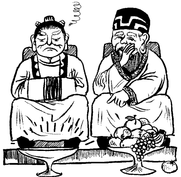
土地公的人緣比土地婆好，這是有典故的。

福德正神在各縣市的寺廟中，被奉為主神（鎮殿）的很少，除了是正宗的土地公廟外，大多是做從神，即配神或附神，與「註生娘娘」奉配於鎮殿的兩偶，所以，土地公可說是最民主最受崇敬之神。