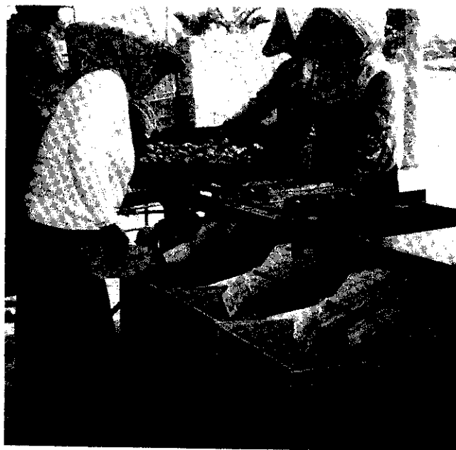
雙喜小番茄有極為嚴格的品質管制

吳班長說，此地小番茄之栽種於每年8月間最為適宜，生長期間如不遇風災、水災之侵害，大約3個月即可開始採摘果實。（果實之生產期約為三個月，即11月中旬至翌年2月中旬）。產銷班一開始即採取嚴格的品質管制，由田園中採取七至八分熟果（太熟則運送易破損腐爛）運回集貨場，經選果機分特、優、良三級處理後，分別以每12公