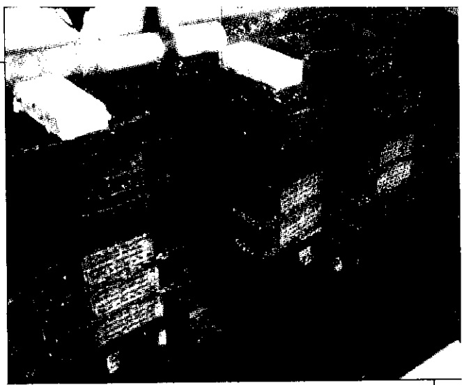
圖2. 九孔養殖籃在池中重疊及排列狀況；中間留有一走道供投放餌料時所用。

養殖期間，每星期投餌一次，每次每籃約400~500公克。龍鬚菜購自台南安平、四草一帶之養殖池，由專門營運龍鬚菜業者收購之後打包，裝入大卡車運至九孔養殖場供