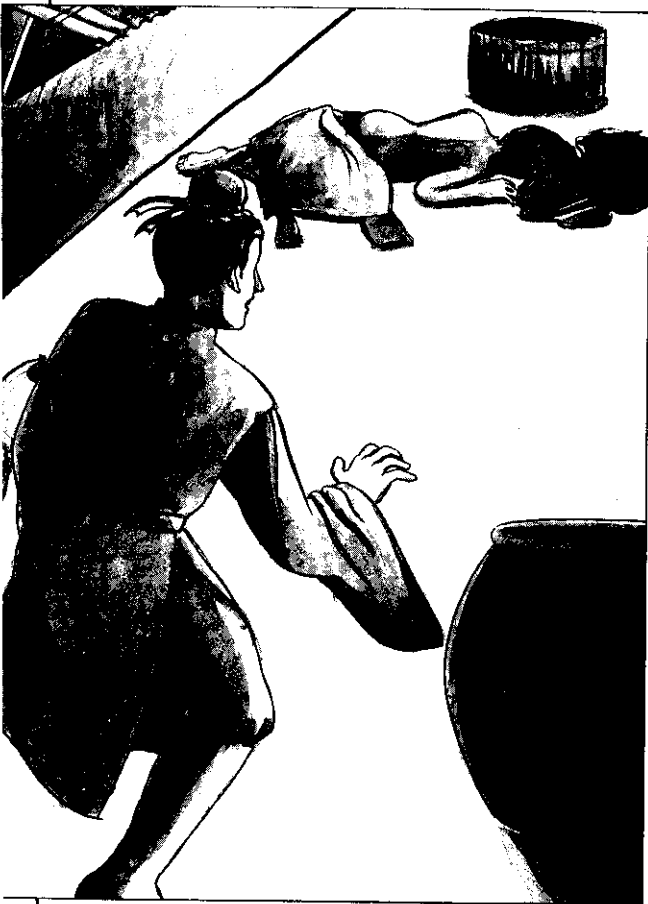
方秀才到後院，發現妻子已倒地身亡。

縣府大人馬上提審方秀才，認為他一回來，其妻即遭橫死，必是他殺妻無疑，嚴刑之下，方秀才受不住痛楚，不得不供認。縣府大人提起毛筆沾了墨水，就要