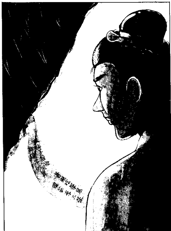
田螺走過的地方，出現一些字跡。