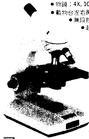
NO: 8160 (1600倍生物) ●目鏡：10X。(16X費用另計) ●物鏡：4X, 10X, 40X, 油100X。 ●載物台左右微調式。 ●無段控制光源。 ●超高解像。