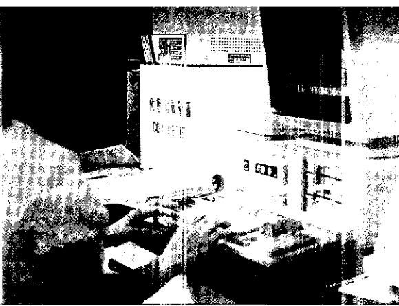
電腦作業是服務中心的特色

「娘」節目常聽到的名詞——「搭起一座友誼的橋樑。」尤其在政府開放部份農產品進口之後，國內一些農產品受到很大衝擊，雖然國外農產品進口可增加消費者選擇項目，有時還享受到價廉物美的東西，可是，卻苦了國內的農民，因為若生產出來的東西賣不出去，自然會影響生計。