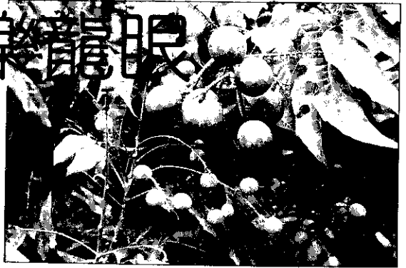
前為常吃的龍眼；後為風味獨特的芭樂龍眼。

在台灣，龍眼和芭樂（番石榴）是人人常吃而極為普遍的熱帶水果。但是，一提起「芭樂龍眼」，恐怕聽過或吃過的人不多。