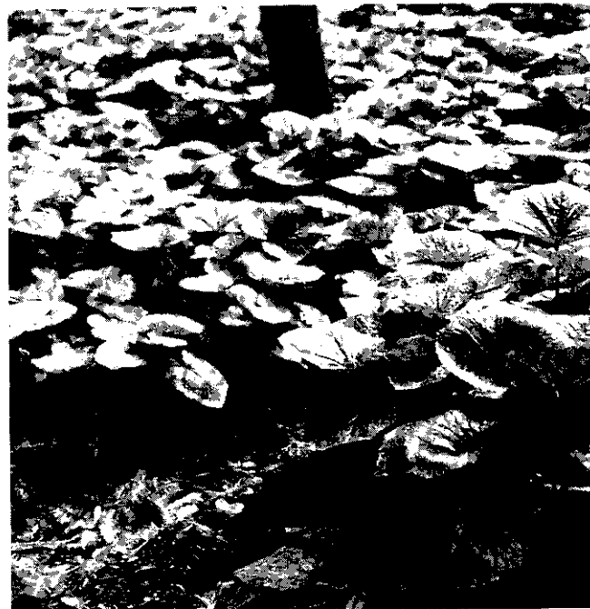
種植於山林蔭處的山葵。