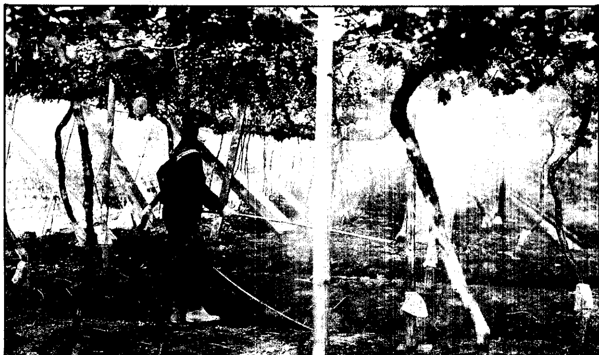
利用長噴桿噴藥，減少藥液沾身。

1. 農藥許可証字號。具有農藥許可証號碼，表示此種農藥已經通過資料審查並完成登記手續，由農委會核發許可証，農友們可放心按照農藥標示上說明使用此種農藥。