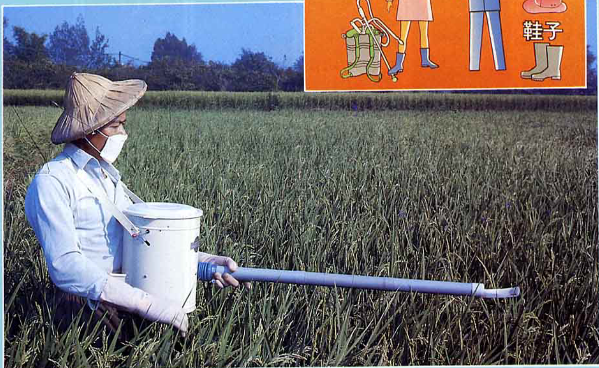
不要逆風噴施農藥。

台灣地區由於高溫多濕，成物種類繁多且栽培密集，所以病虫草害種類較其他地區為多，如不予防治即嚴重影響作物產量、品質。因此作物保護向為台灣農業生產上很重要之一環，而使用農藥即成為最經濟迅速而有效的防