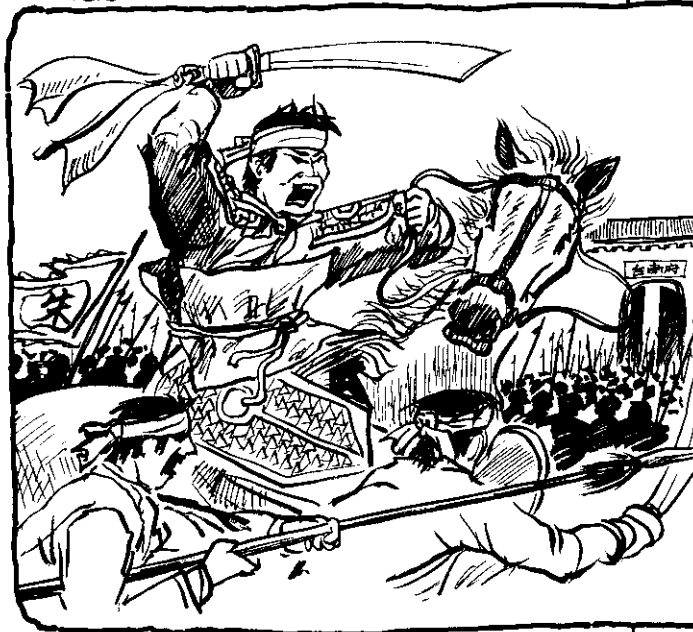
鴨母王揭竿起義，揮兵先克復台南以南的地方。

第二天一早，他到鴨欄裏拾取鴨蛋，想不到奇怪的「事」又發生了，他發現一隻鴨屁股下面有兩個蛋，逐一檢查結果，每一隻鴨母都是生了兩個蛋，他心裏想這樣倒好，如果每一隻鴨母一天都生兩個蛋，真是連皇帝都想不到做了。不過他又想到「天意」不可違背，所以一頭腦裏仍在想，著要如何才能順從「天意」。鴨母會排陣而且每天生兩個蛋的「消」