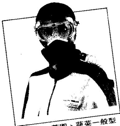
稻田、茶園、蔬菜一般型