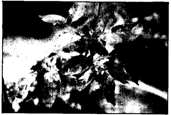
馬鈴薯被番茄斑潛蠅為害狀

番茄斑潛蠅在本省最近幾年始發生為害，有關其生態及防治措施，目前尚在有關農業機構研究探討中。為應緊急防治，已篩選出防治效果較佳之藥劑有75% Trigard WP（汽巴讚）稀釋5000倍，24% Vydate EC（萬強）稀釋1000倍，5% Atabron EC（得福隆）稀釋2000倍及25% Insegar WP稀釋2000倍。但此等藥劑中除75% Trigard WP已經正式委託試驗，經政府審查推薦於菊花、非洲菊之