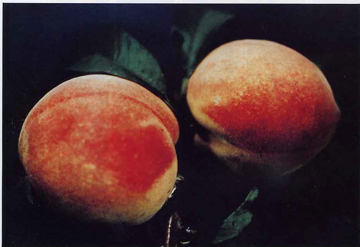
台農甜蜜屬中型果，於4月中、下旬成熟，市場價格好，糖酸比高。

本省桃樹的栽培根據對環境的適應性，可分為兩類，第一類為適合本省中低海拔地區種植的脆桃群，如“鶯歌桃”、“烏枝桃”、“六月桃”、“晚桃”等屬之。這些品種為先民早年自我國華南一帶引入，成熟時果肉硬、脆而不會變軟，果實形狀呈卵圓形，有些品種果頂有鳥嘴狀突起，果實著色差，甜度低