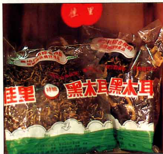
黑木耳成品每包售價100~120元，希望國人多用國產品。

資及雜支的全部費用，等於在台灣買一個太空包的成本而已。如此懸殊的成本比例，當然不是競爭對手。