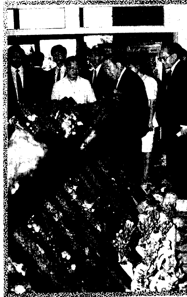
行政院郝院長參觀菇類栽培區

“保育。因此，農業是國家建設重要的部門，隨著國家建設6年計劃農業部門計劃的實施，將以追求生產、生活與生態三方面平衡發展的目標，從傳統的窠臼，全面脫胎換骨，轉變為高品質、高效率與精緻化、企業化的產業，迎接21世紀農業新境界的來臨！