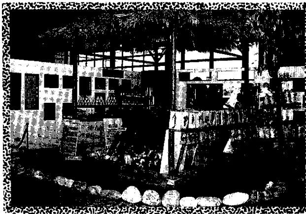
精緻農業成果展一角——菇類栽培區

“保育。因此，農業是國家建設重要的部門，隨著國家建設6年計劃農業部門計劃的實施，將以追求生產、生活與生態三方面平衡發展的目標，從傳統的窠臼，全面脫胎換骨，轉變為高品質、高效率與精緻化、企業化的產業，迎接21世紀農業新境界的來臨！