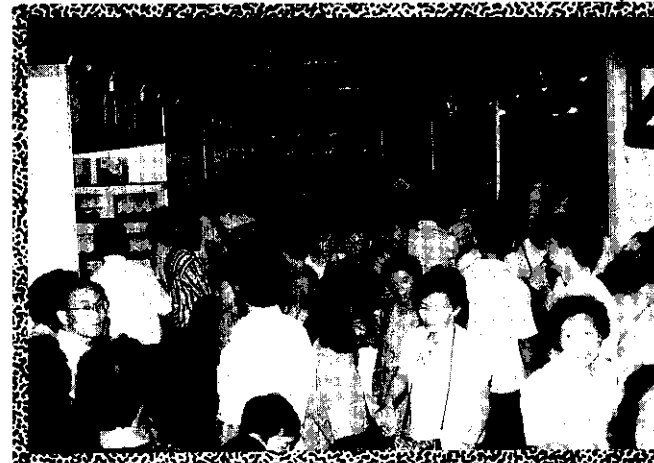
9月6日~10日展出期間，吸引了16萬以上的民衆參觀，創下歷年來農業展覽參觀人數最多的一次。